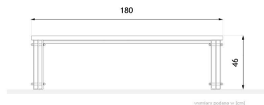
wymiary podane w [cm]