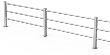
2 x Valid Post 01.088.1