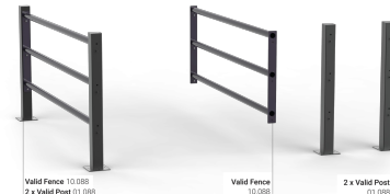
Valid Fence 10.088 2 x Valid Post 01.088