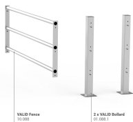
Valid Fence 10.088